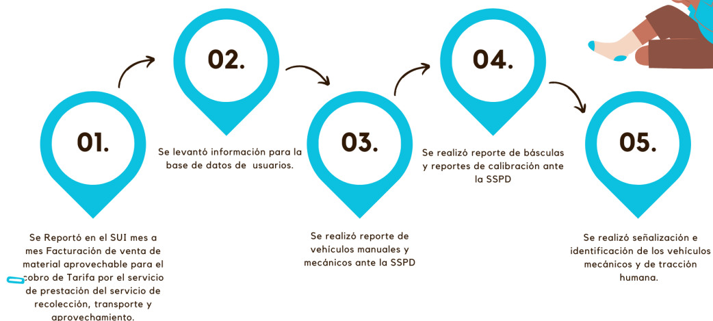
Gráfica 2. Resultados Eje estratégico 3.