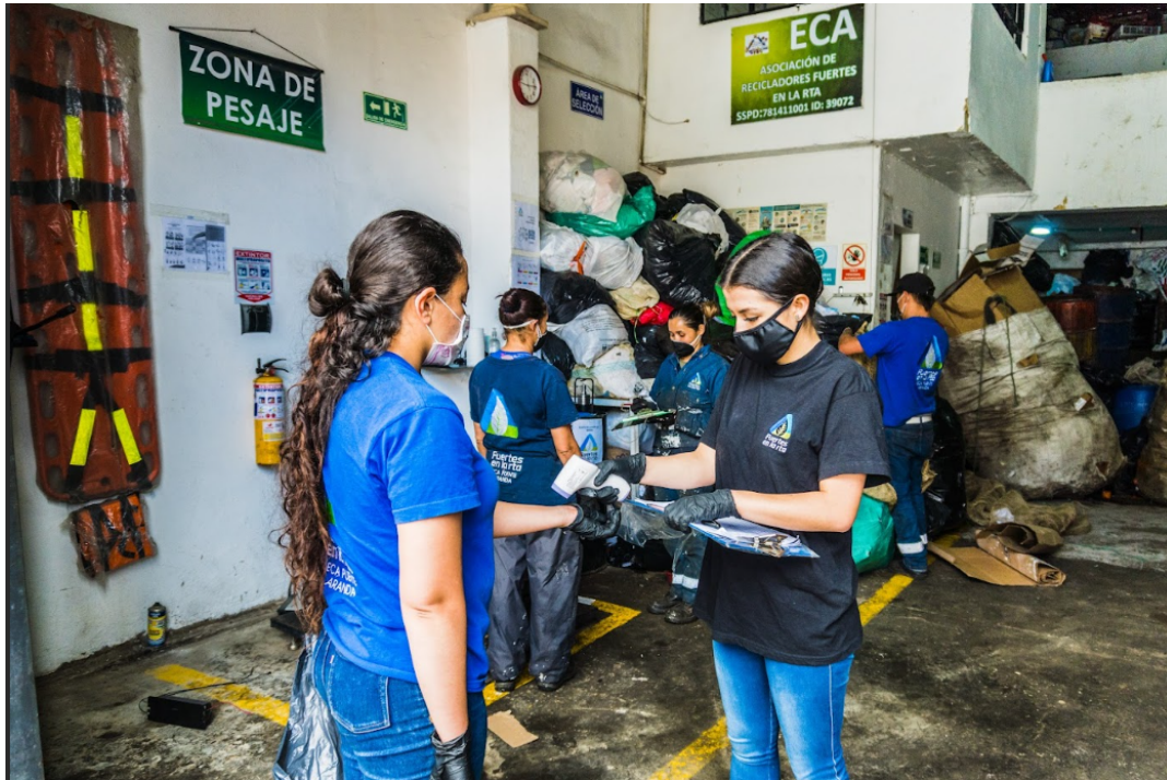
Fotografía 2. Recolección de datos para el control y monitoreo de estado de salud de recicladores de oficio en ECAs.