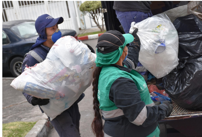
Fotografía 3. Recolección de residuos aprovechables en Bogotá, prestación del servicio por parte de los asociados.