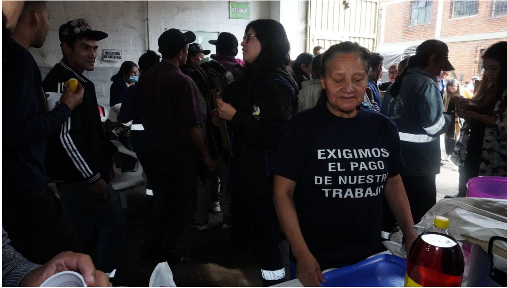
Fotografía 6. Actividad de bienestar a asociados de la asociación.