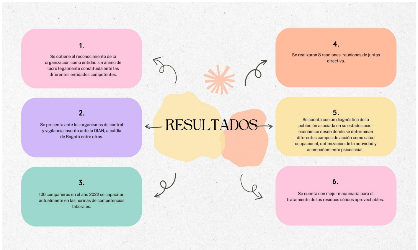
Gráfica 1. Resultados Eje estratégico 2.

ambiental vigente , uso de EPPS, sistema de salud y seguridad en la actividad, higiene postural, pausas activas, manejo de cargas, entre otros.