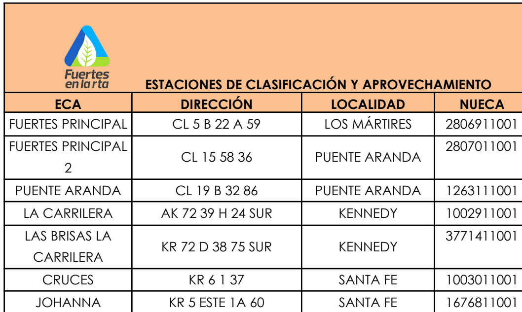
Tabla 1. Registro de ECAs de la organización