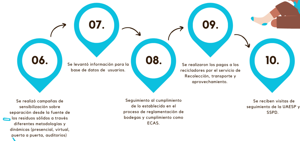
Gráfica 3. Resultados Eje estratégico 3.