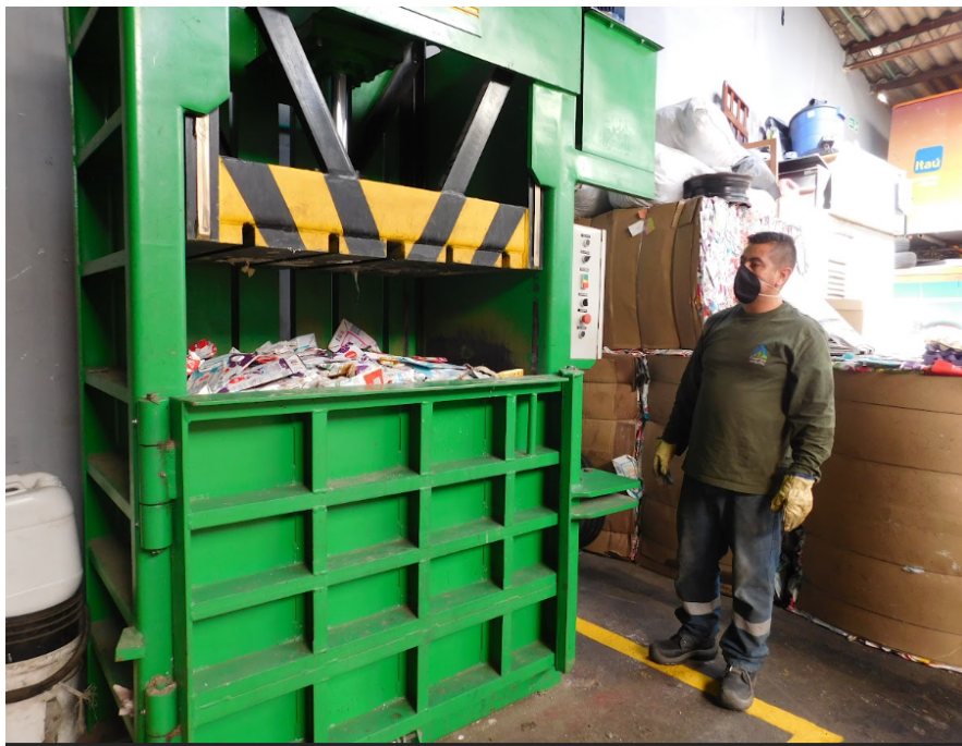
Fotografía 1. Proceso de Embalaje residuos aprovechables por parte de los recicladores de oficio de la ASOCIACIÓN DE RECICLADORES FUERTES EN LA RTA

En el año 2022 seguimos con la consolidación de los puntos de trabajo de la organización, se intentó fortalecer el trabajo gremial, el cumplir con los objetivos y requisitos mínimos que las entidades de vigilancia y control supervisan en las ECAs.