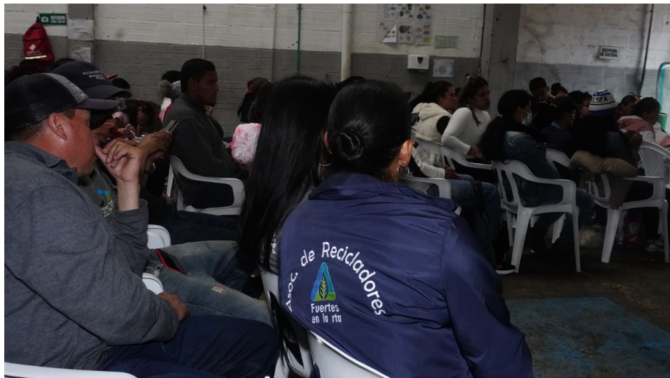
Fotografía 4. Asamblea general ordinaria, presidida por ASOCIACIÓN DE RECICLADORES FUERTES EN LA RTA.