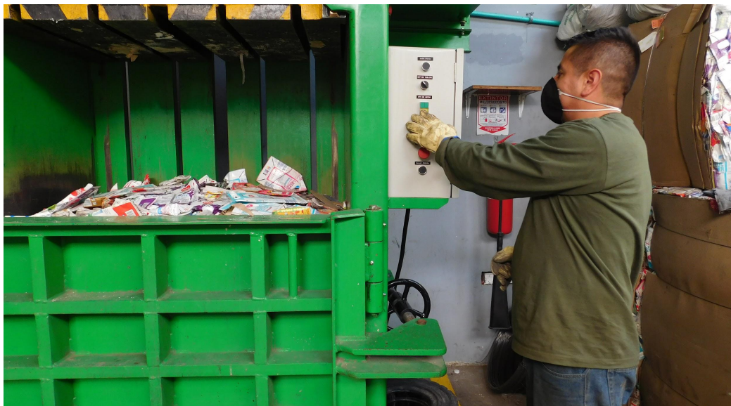
Fotografía 5. Proceso de Embalaje residuos aprovechables por parte de los recicladores de oficio de la ASOCIACIÓN DE RECICLADORES FUERTES EN LA RTA