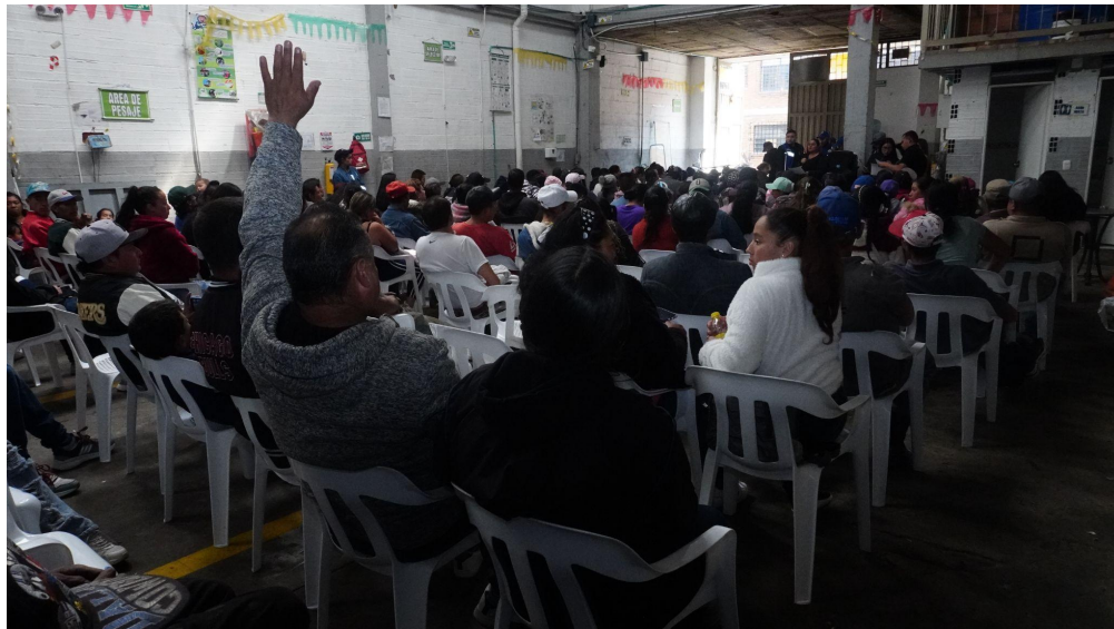
Fotografía 7. Asamblea general ordinaria año 2023.